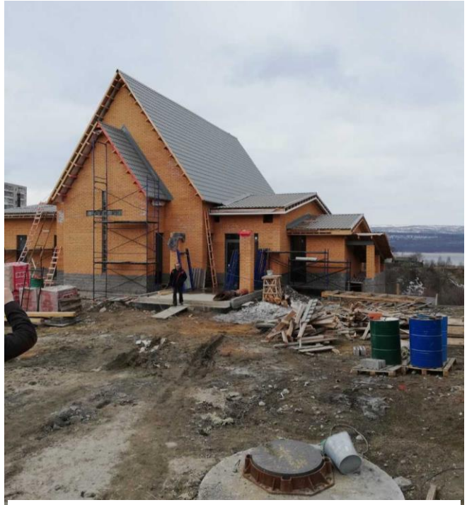
Luterilainen kirkko rakenteilla Kolassa Murmanskin liepeillä. Kirkon rakentamisen rahoittavat muutamat pohjoissuomalaiset seurakunnat ja toteuttavat venäläiset rakentajat.

Metropoliitan asema suoraan patriarkan ja sitä kautta presidentin luottomiehenä näkyy kaikessa. Turvatoimet hänen ympärillään olivat vahvat. Hänen tapansa ottaa vieraat vastaan kertoi suuresta