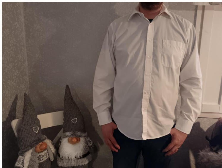
Kuva 3. Uuden ostamisen sijasta esimerkiksi kirpputorilta voi löytää hyväkuntoisia työkäyttöön soveltuvia vaatteita ja edistää näin kiertotaloutta. Kuvan paita maksoi vain 2 €.