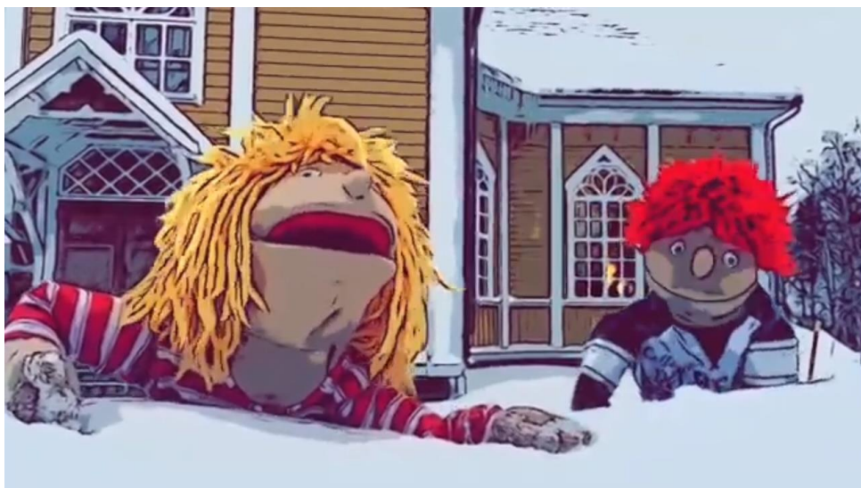
Kuva 2. Lapsityön käsinukkehahmot Sulo ja Lahja laulavat joululaulua pakkassäässä joulukuussa 2023 Himangan kirkon pihalla. Kuva liittyy lasten joulukirkon videoinserttiin.

Jumalanpalvelus on lähtökohtaisesti luonteva paikka luomakunnan esillä pitämiseen puheessa ja musiikissa, sillä onhan luomisen teema keskeistä kristillisessä uskossa. Jumalanpalveluksia järjestetään kaikissa kolmessa kirkossa: Kalajoella, Himangalla ja Rautiossa. Myös musiikin kautta voi toteuttaa ympäristökasvatusta. Monet luomakuntaa, kevättä, isänmaata ja kotia käsittelevät virret kertovat luonnosta ja ympäristöstä. Luomakunnan sunnuntaita on vietetty Kalajoen seurakunnassa vuosittain esimerkiksi nuorisotyön työalalla, sekä sadonkorjuun kiittämisen juhlana. Luomakunnan teemat ja ympäristöaiheet ovat esillä myös seurakunnan monissa tilaisuuksissa, joita on listattu katselmustaulukkoon. Tilaisuuksia järjestetään myös yhteistyössä muiden tahojen kanssa.