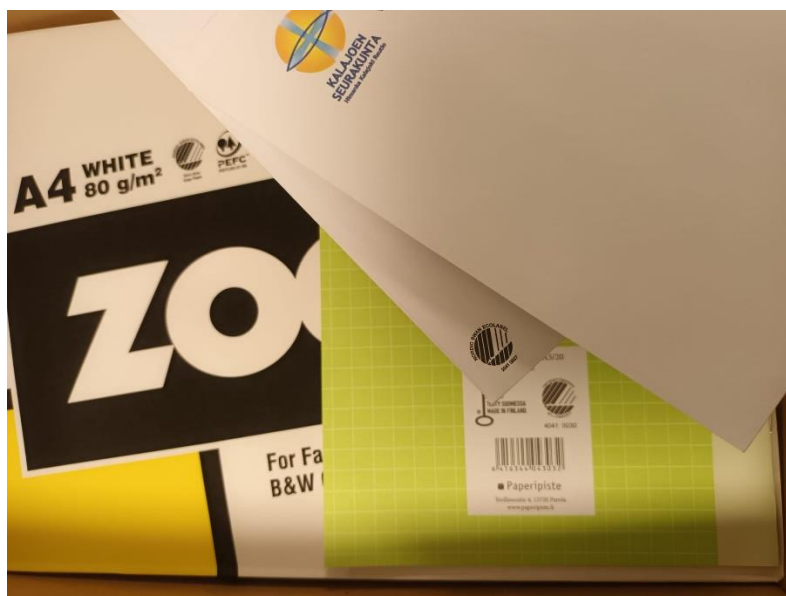
Kuva 1. Seurakunnan käyttämä toimistopaperi on ympäristömerkittyä.

Kirkko tavoittelee hiilineutraaliutta vuoteen 2030 mennessä. Se vaatii toimenpiteitä jokaiselta seurakunnalta. Kalajoen seurakunnan suunnitelma kohti hiilineutraaliutta on muotoutumassa.