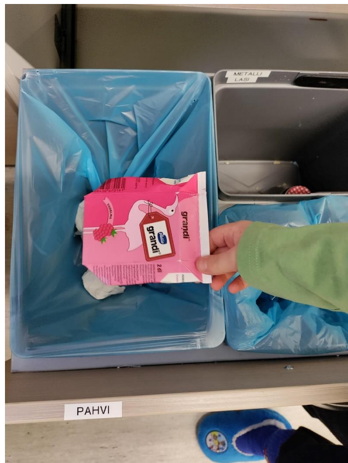
Kuva 4. Päiväkerhoissa opetellaan pikkuhiljaa omien eväsroskien lajittelua.

Nuorten illoissa kokkaillaan säännöllisesti kasvisruokaa ja kasvisvaihtoehtoa tarjotaan aina. Myös muilla työaloilla toteutetaan tarjoiluja ja kahvitilaisuuksia. Kotimaista lihaa käytetään, jos lihaa on tarjolla. Tätä onkin erityisesti suositeltu seurakunnassa. Reilun kaupan kahvia käytetään Jokelan pappilassa omissa kahvituksissa, sekä satunnaisesti esimerkiksi nuorisotyössä. Työalat hankkivat itse tarvitsemansa ruokatarvikkeet. Tilaisuuksista ylijäänyttä ruokaa voidaan pakastaa sovittaessa keittiöiden pakastimissa. Kertakäyttötuotteiden käyttö on rajattu erityistilanteisiin esimerkiksi kirkkokahveille, sillä sen on huomattu laskevan vapaaehtoisten seurakuntalaisten kynnystä uskaltautua mukaan kahvituksiin.