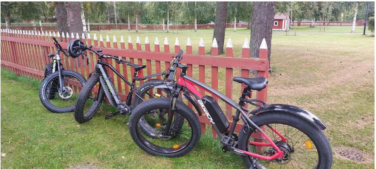
Kuva 10. Työntekijöiden sähköpyöriä.

(Toteutusaika: 2024–2029. Vastuhenkilö: talouspäällikkö)