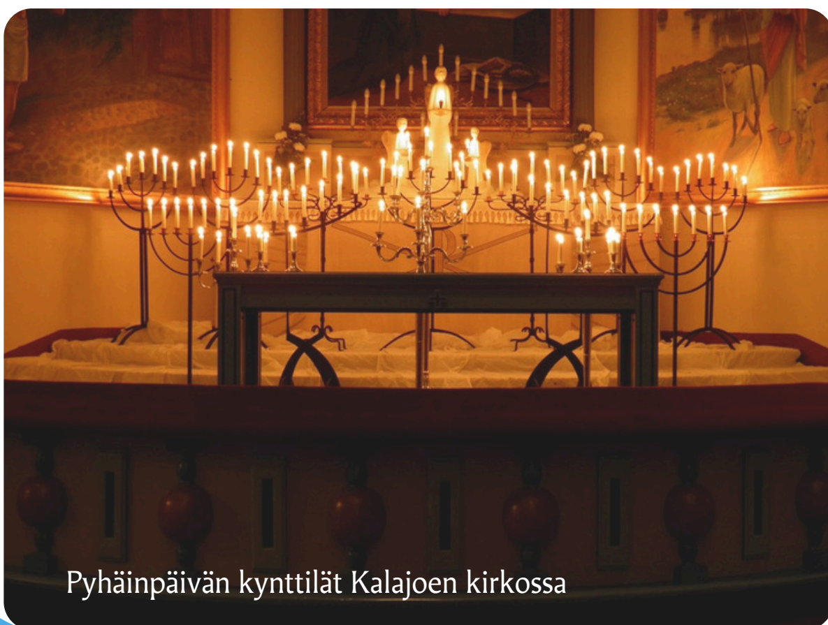
Pyhäinpäivän kynttilät Kalajoen kirkossa

Pyhäinpäivänä seurakunnassa on tapana muistaa vuoden aikana kuolleita seurakunnan jäseniä. Tieto muistohartaudesta lähetetään hautauksesta sopineelle omaiselle, joka tiedottaa muita omaisia.