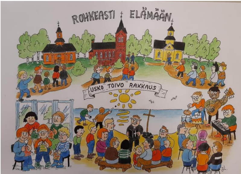
Rohkeasti Elämään – Kalajoen seurakunnan ovet auki -strategia.

Kalajoen seurakunta on kolmen kirkon seurakunta, joka uudistaa toimintaansa perinteitä unohtamatta. Toimintamme rakentuu kirkon yhteisten arvojen pohjalle, joita ovat usko, toivo ja rakkaus .