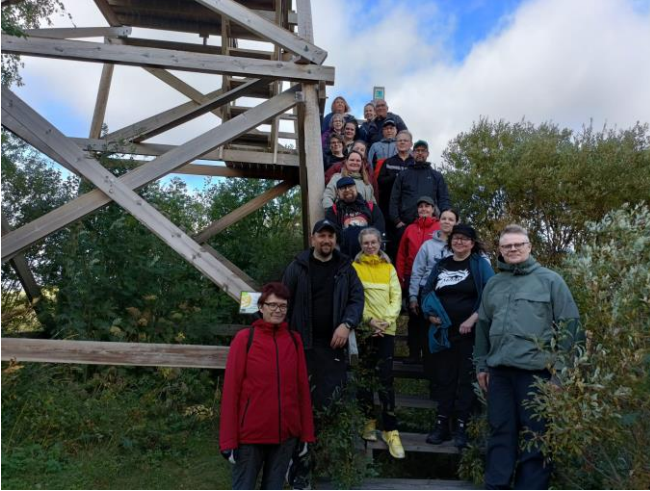
Kalajoen seurakunnan työntekijät virkistyspäivässä 4.9.2025 Vihasniemen lintutornilla.